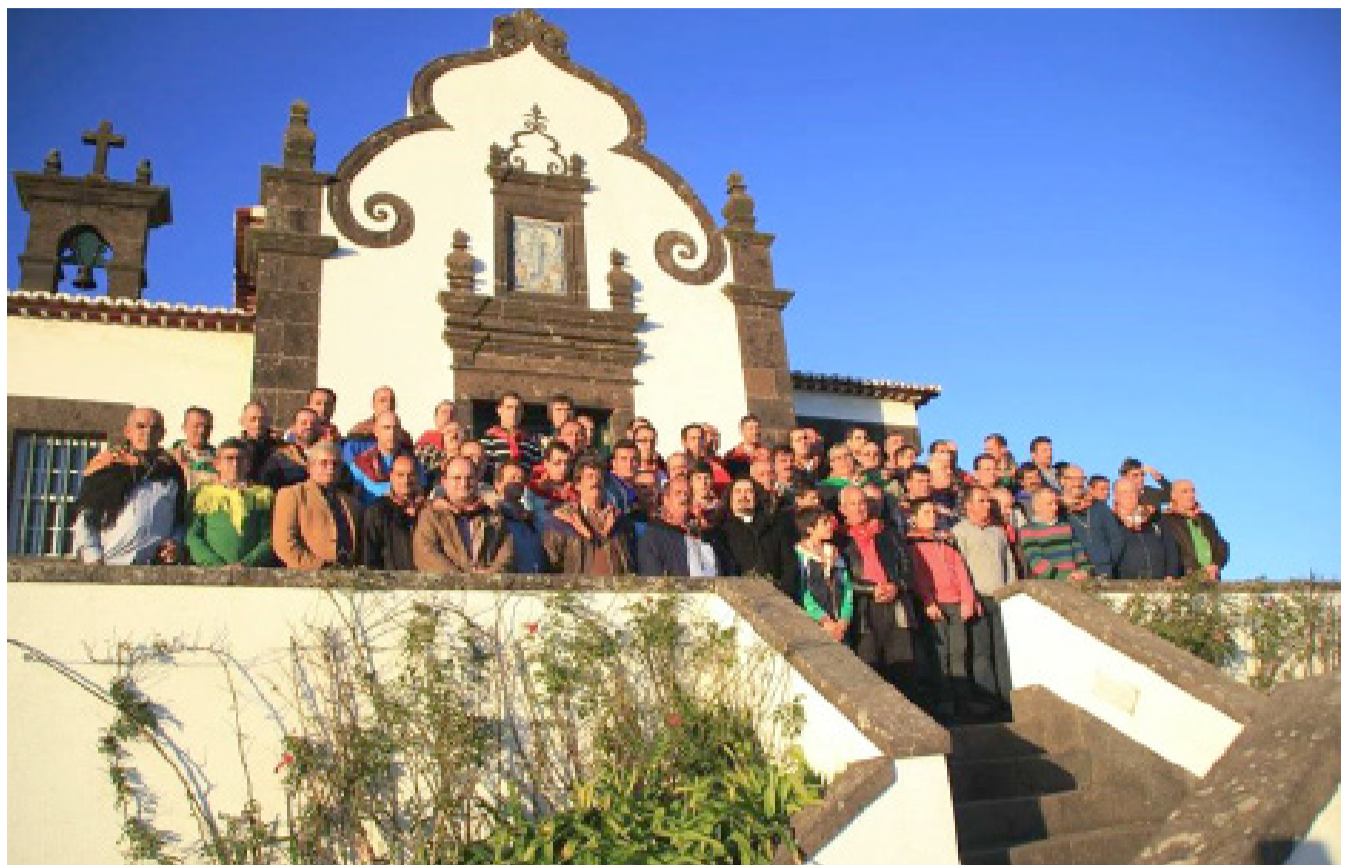
FOTO Romeiros de Vila Franca do Campo - Novembro 2015

« Não se vence a violência com mais violência... Senhor dai-nos a paz. Em nossos dias » Papa Francisco